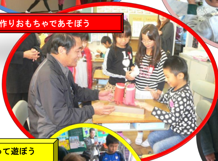
2年 手作りおもちゃであそぼう