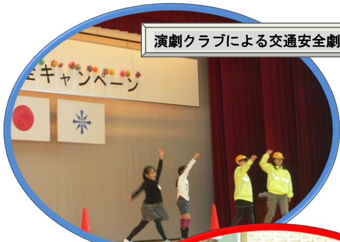
演劇クラブによる交通安全劇