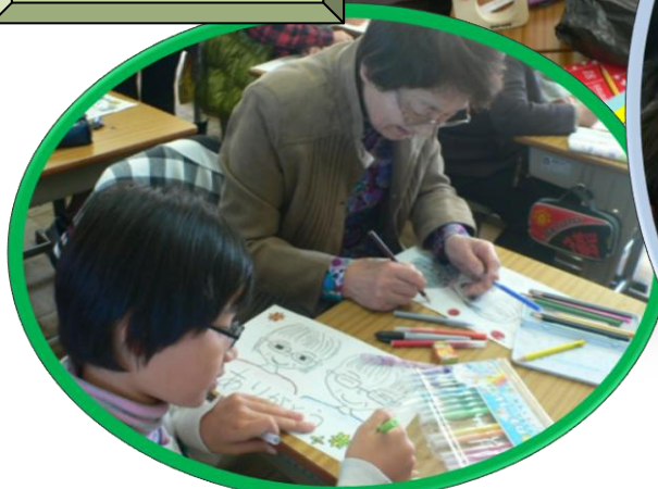
5年 描いて押して 作品づくり