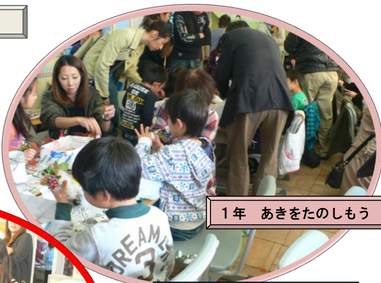
1年 あきをたのしもう